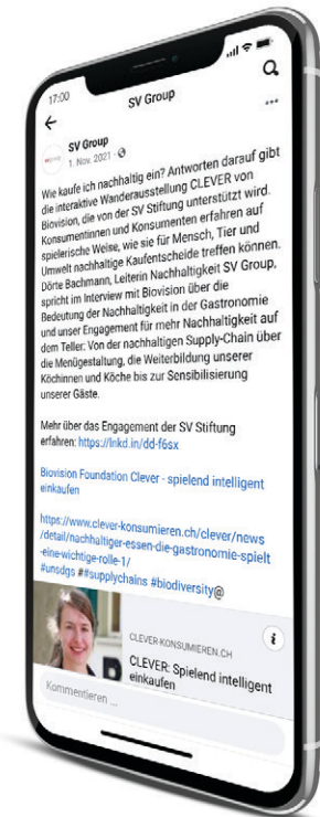
Communication commune de SV Group SA et SV Fondation, p. ex. via Facebook.